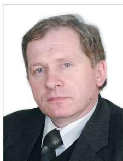
ПУСКИН Александр Владимирович